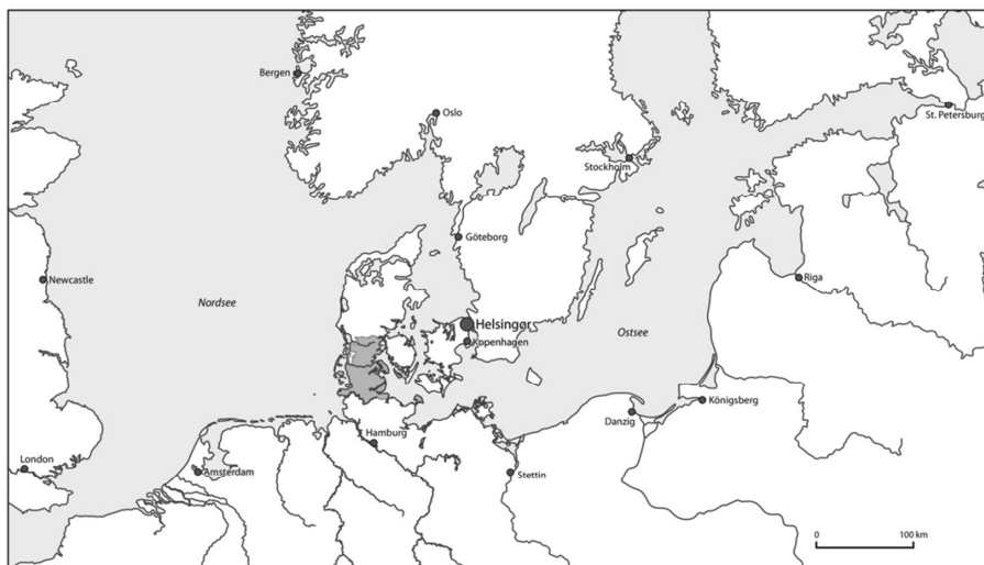
Karte 1: Das Herzogtum Schleswig und der Sundzoll. Auf der Karte sind die wichtigsten Häfen, die in den Sundzollrechnungen genannt werden, eingezeichnet (Karte: Günther Bock).

Im Öresund wurde bei Helsingör seit 1427/29 Zoll von Seiten der dänischen Krone erhoben, und es wurden Abrechnungen über jedes Schiff geführt, das den Sund passierte 1 . Damit wurde die gesamte Schifffahrt zwischen Nord- und Ostsee erfasst, als auch für Schiffe, die in den Großen oder Kleinen Belt auswichen, der gleiche Zoll eingeführt wurde. Besonders unter Christian IV. (König von 1588 bis 1648) wurde der Sundzoll als Machtmittel benutzt, das jeder politischen Vernunft entbehrte. Wiederholt ließ er den Öresund sperren, um höhere Zollsätze durchzusetzen. So brachte er vor allem Schweden und die Niederlande gegen sich auf 2 . Je höher der Zoll, desto mehr nahm aber auch der Schmuggel zu, so dass die in den Zollrechnungen aufgeführten Waren höchstens einen Ausschnitt der tatsächlich mitgeführten Waren darstellen 3 . Dennoch lassen sich die Zollrechnungen benutzen, wenn man die richtigen Fragen an sie stellt.