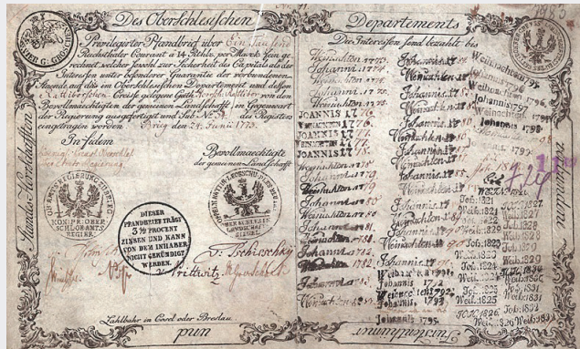
Pfandbrief der Schlesischen Landschaft vom 24. Juni 1773.

Diese Entwicklung stärkte nicht nur die lokalen Sekundärmärkte, sondern führte auch zur Notierung der ersten Pfandbriefe auf den Kurszetteln der Börsenmakler in Breslau, Königsberg und Berlin, sodass sie für eine breitere Schicht von Investoren zugänglich wurden. 27 Der erste schriftliche Beleg für den börsenartigen Handel mit Pfandbriefen ist ein Kurszettel des Breslauer Maklers Simon Wolff aus dem Jahr 1786, auf dem der Pfandbrief der Schlesischen Landschaft erschien. Eine Börse im eigentlichen Sinne gab es zu dieser Zeit in Breslau freilich noch nicht. Die Makler vermittelten Geld- und Wertpapiergeschäfte zwischen den Banken, indem sie täglich persönlich bei ihnen die Runde machten, um nach ihren Kauf- und Verkaufsinteressen zu fragen. 28