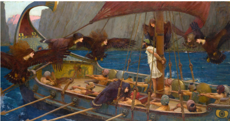
Odysseus und die Sirenen (Gemälde von John Williams Waterhouse, 1849–1917)

Mit diesen Worten warnt die Zauberin Kirke Odysseus vor Gefahren, die auf seiner Reise vor ihm liegen, nachdem dieser sich endgültig entschlossen hat, seine Geliebte zu verlassen. In der »Odyssee« wird beschrieben, dass Odysseus die Ohren seiner Gefährten mit Bienenwachs verschloss, damit sie den Gesang der Sirenen nicht hörten. Aber nicht nur in