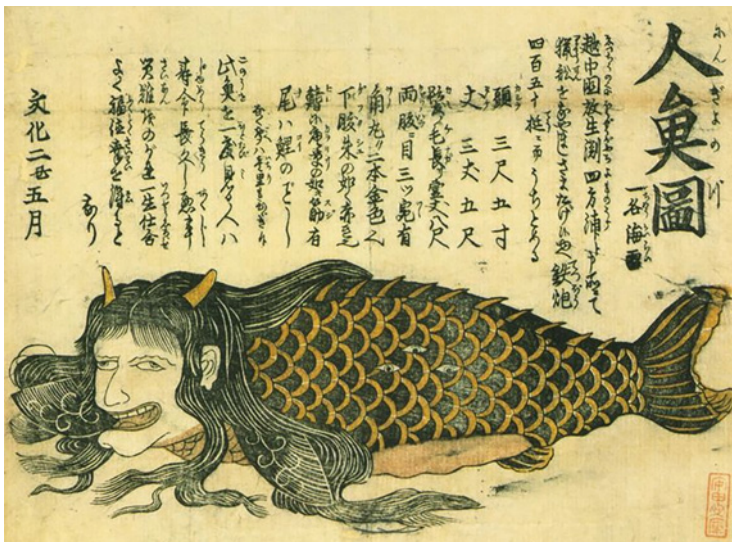
Meerjungfrau, die angeblich 1805 in Japan gefangen wurde (zeitgenössischer Holzschnitt).

Trotz der zoologischen Entmystifizierung ließ sich der Glaube an die reale Existenz von Mischwesen zwischen Mensch und Fisch keineswegs ausrotten. Für die unvermindert hohe Popularität von Sirenen oder Meerjungfrauen spricht der schwunghafte Handel, der im 18. und 19. Jahrhundert in fast allen Hafenstädten Europas und Amerikas mit vermeintlichen Mumien dieser Wesen getrieben wurde. Besonders begehrt waren Importe aus Japan, geschickt zusammengebastelt aus getrockneten Affen- und Fischteilen und auf Jahrmärkten ehrfürchtig bestaunt vom zahlenden Publikum. Ein besonders gelungenes Exemplar schaffte es sogar bis ins renommierte amerikanische Peabody-Museum in Baltimore.