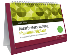
Arzneimittelsicherheit im Fokus Mitarbeiterschulung Pharmakovigilanz ISBN: 978-3-7692-7220-8