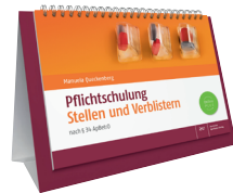
Arzneimittel patientenindividuell verpackt Pflichtschulung Stellen und Verblistern ISBN: 978-3-7692-6902-4