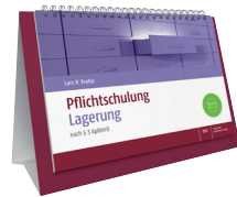
Lagern – mehr als Aufbewahren Pflichtschulung Lagerung ISBN: 978-3-7692-6778-5