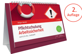
Arbeitsschutz mit Sicherheit Pflichtschulung Arbeitssicherheit ISBN: 978-3-7692-6907-9