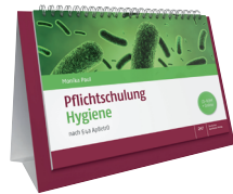
Hygiene pur Pflichtschulung Hygiene ISBN: 978-3-7692-6555-2