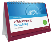
Meistermacher Pflichtschulung Herstellung ISBN: 978-3-7692-6779-2