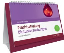
Sicherheitsrisiko Blut Pflichtschulung Blutuntersuchungen ISBN: 978-3-7692-7252-9