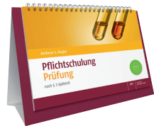
Geprüft und für gut befunden Pflichtschulung Prüfung ISBN: 978-3-7692-6780-8