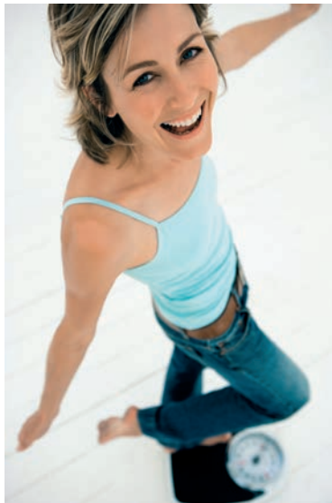
Schönheitsideale aus zwei Jahrhunderten: Frauenbildnis von Rubens und »modernes« Model auf der Waage.