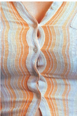
Nur Modesünde oder bereits Übergewicht?

Im Gegensatz zur Frau war der Mann von derartigen Zwängen lange Zeit unbehelligt. Dicke Männer galten noch bis vor kurzem als »gemütlich«, »ausgeglichen« und »in sich ruhend«. Das trifft inzwischen nicht mehr zu. Auch »runde« Männer sehen sich zunehmend der Kritik ausgesetzt, die sich vornehmlich am schlanken Waschbrettbauch-Model orientiert. Die Diskriminierung der »Dicken« reicht vom Vorwurf mangelnder Leistungsfähigkeit, Faulheit, Unbeweglichkeit und des Ungeliebtseins bis hin zur Forderung nach höheren Krankenversicherungsbeiträgen für Schwergewichtige. Das Gewicht, das das jeweils geltende Schönheitsideal bestimmt und auch fordert, soll hingegen Attraktivität, Gesundheit und Erfolg garantieren. Der psychische Druck, den diese Norm auf viele junge Frauen (und auch immer mehr Männer) ausübt, zeigt sich in der wachsenden Zahl von Ess-Störungen in der Bevölkerung. Der Versuch, sich zwanghaft einem überzogenen Ideal anzunähern, das den eigenen genetischen Voraussetzungen zuwiderläuft, muss zum Scheitern verurteilt sein (s. a. Kapitel ab Seite 50). Die Anlage zur Modelfigur haben die wenigsten Menschen.