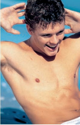
Auch Männer orientieren sich zunehmend an von Medien vorgegebenen Idealen.

als ein erstrebenswertes Ideal von der Werbung angepriesen werden, eher der magersüchtigen Kategorie zuzuordnen. Jung, groß und schlank – das heutige Maß aller Dinge?