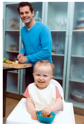
Erziehung und Esstradition beeinflussen schon früh die Entstehung von Übergewicht.

Andere Menschen, die genauso abhängig von äußeren Reizen sind, können ihr Gewicht jedoch halten. Warum? Es gelingt ihnen mit Hilfe einer starken geistigen Kontrolle ihres Essverhaltens, also mit Disziplin. Diese mentale Kontrolle ersetzt die verloren gegangenen inneren Mechanismen, die Hunger und Appetit normalerweise im Zaum halten würden.