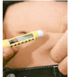
Durch die Injektion von Insulin – wie hier mit einem einfach zu handhabenden Pen – wird Ihre Bauchspeicheldrüse »geschont«.

Alle drei Medikamente können jedoch erst nach sorgfältiger Prüfung durch den Arzt verschrieben werden, da Ihre Nebenwirkungen