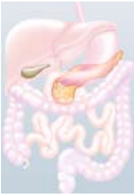
Insulin, das Hormon aus der Bauchspeicheldrüse (s. rote Umrandung), ist für den Zuckerstoffwechsel mitverantwortlich.

Diabetes mellitus ist eine Stoffwechselerkrankung, bei der in erster Linie die Verwertung der Kohlenhydrate gestört ist. Zu den Kohlenhydraten unserer Nahrungsmittel zählen alle Zuckerarten und die Stärke. Im Allgemeinen wird der Stoffwechsel durch »Botenstoffe«, d.h. durch Hormone, gesteuert. Von herausragender Bedeutung ist dabei das Insulin.