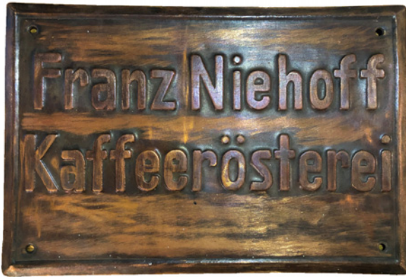
Original Niehoff Firmenschild aus den 80ern