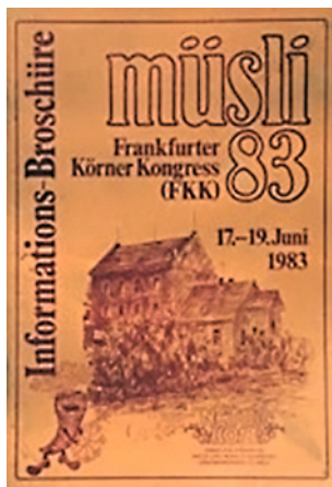
Programmheft der ersten Müsli-Messe, 1983

»Um die Messe vorzubereiten, haben wir schwer geschuftet. Ich habe jede Menge schwere Honigkisten in den 4. Stock geschleppt, wir haben eine lebendige Kuh ins Foyer gestellt.« Anders als heute ihr Nachfolger, die Biofach, ist die »Müsli« der Anfangsjahre familiär, man