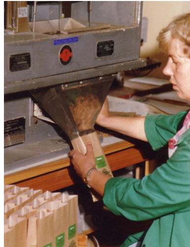
Erste mechanische Abfüllmaschine. Abgefüllt wird Haustee, ein noch heute bestehender Klassiker, Mitte der 1980er Jahre