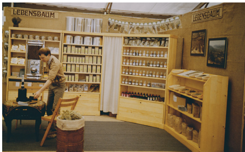
Lebensbaum Messestand, 1986