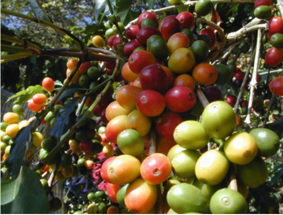
Kaffeekirschen am Kaffeestrauch: Reif sind die roten Kaffeekirschen, von grün über gelb bis rot sind verschiedene Reifestadien zugleich am Strauch

oder Italien. Sie suchen Landwirte, die einerseits den Methoden des biologischen Landbaus folgen und andererseits etwas vom Kräuteraanbau verstehen. In Deutschland ist der Kräuteraanbau nur noch in wenigen Regionen zu finden, zum Beispiel im Bodenseeraum, in Teilen Hessens und Bayerns.